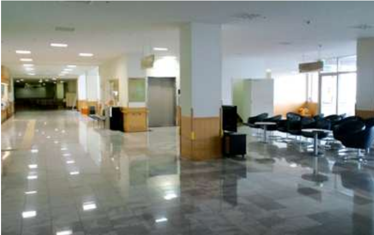
正面入り口待合ホール

写真右奥には、津軽海峡を見渡せるテラスがあります。奥に外来診察室及びレントゲン室・リハビリテーション室があり、写真手前に薬剤室、透析室があります。