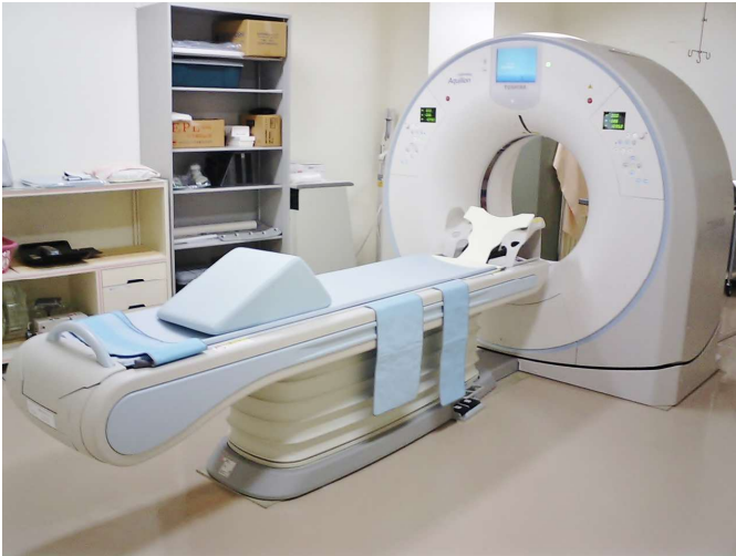
マルチスライスCT（16列）