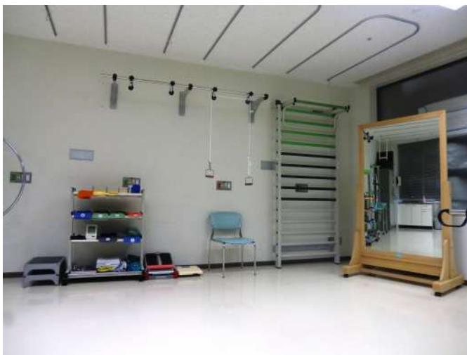
リハビリテーション室